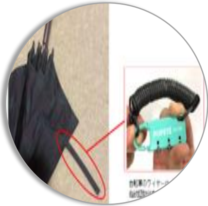
指紋認証盗難防止機能付き傘