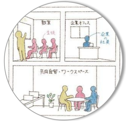
学校×企業で育む地域と未来